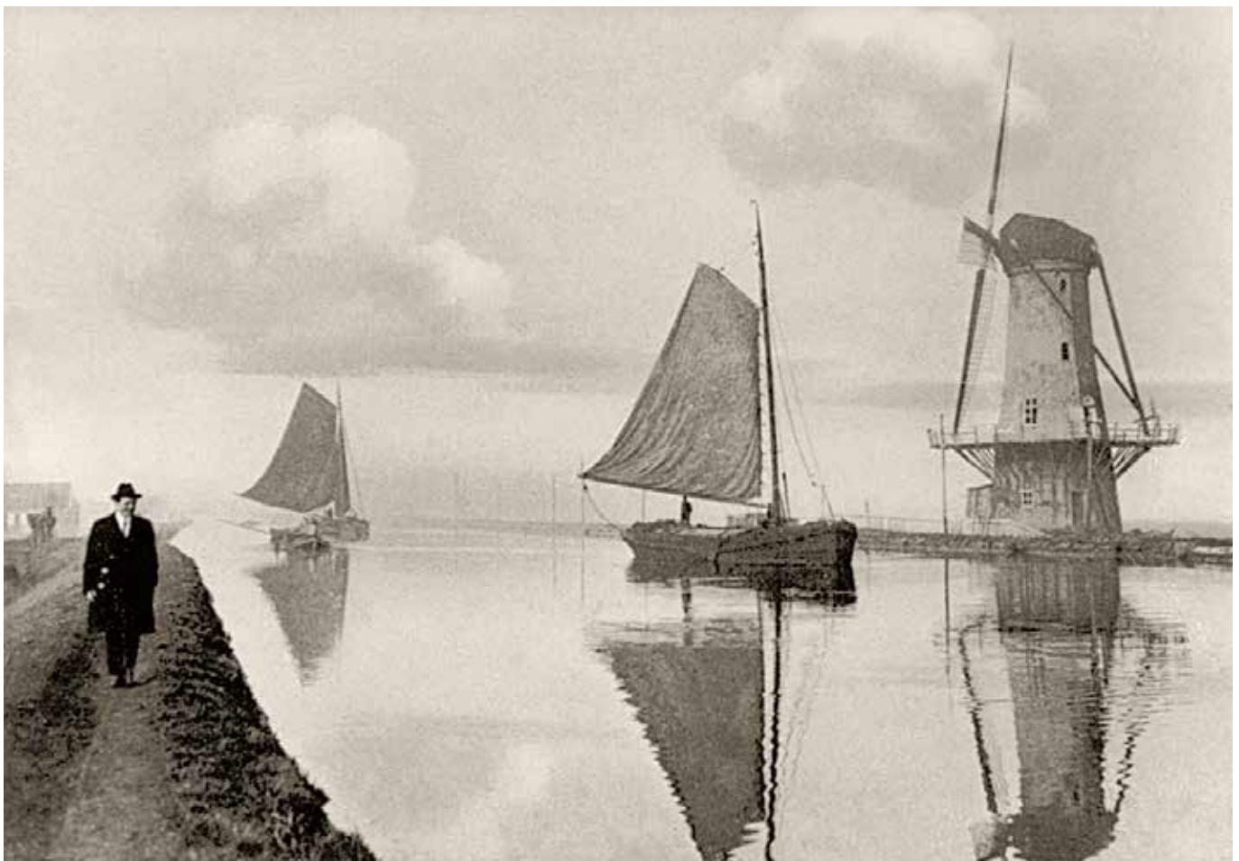
Delftsche Schie