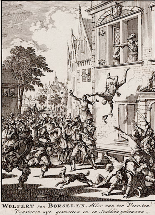
Wolfert van Borselen te Delft uit het raam geworpen en gelyncht (tekening Jan Luyken 1299)