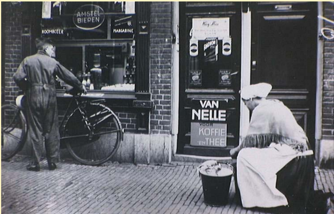
Den Haag, Tasmanstraat 13, kruidenierswinkel; op de voorgrond een Scheveningse visvrouw met haar negotie, 1934

Thimo de Nijs (Opleiding Geschiedenis Universiteit Leiden) Jan van den Noort (Werkgroep Stedengeschiedenis)