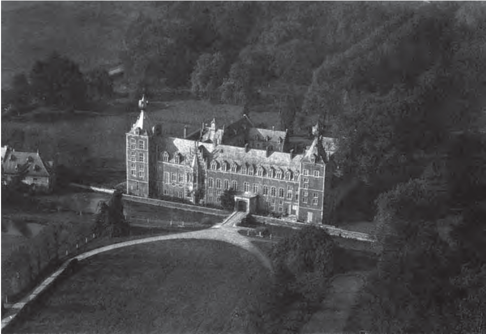
Afbeelding 3: Ongedateerde luchtfoto (vermoedelijk uit de jaren 1920) van het Arenbergkasteel en een deel van het omliggende park (Stadsarchief Leuven, Fototheek).

kon hebben op het stedelijk leefmilieu, was dus ook aan het begin van de jaren 1920 nog niet algemeen aanvaard. Rooien zonder te herbepplanten werd door Le Libéral echter afgewezen als een 'extreme' suggestie. 41