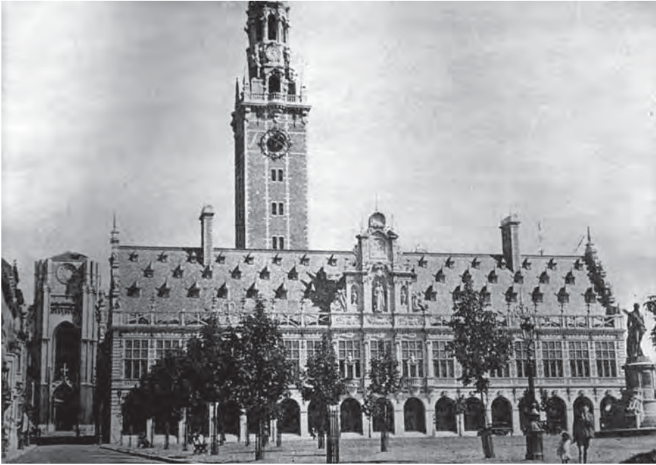
Afbeelding 2: De nieuwe boompjes van de Volksplaats, vermoedelijk aan het eind van de jaren 1920.

deze strategie vooral trachtte om het stadscentrum aantrekkelijker te maken voor de meer gegoede bewoners. 35