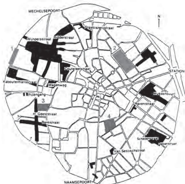
Afbeelding 1: Locaties van door Lens geplande groen-zones: (1) Park ter vervanging van de schietbaan; (2) Park ter vervanging van de Sint-Maartenskazerne. Bestaande openbare groenzones in 1918: (3) Kruidtuin; (4) Stadspark; (Ringtraject) Stadsvesten. De zwarte vlakken duiden op wijken met een grote concentratie van arbeiderswoningen. (Op basis van kaart uit: J. Brepoels e.a. [red.], Stadsboek Leuven [Leuven 1985] 106.)

(afgekort NMGW). 25 Het Leuvense rapport bevatte immers geen spoor van de initiële naoorlogse doelstelling van de NMGW om via tuinwijken een nieuwe sociale cohesie te creëren, en ook de intentie om lagere en middenklassen in eenvormige woonwijken samen te brengen, was helemaal afwezig. De tuinwijk verscheen bij Lens niet als de ruimte waar een nieuw gemeenschapsleven tot stand moest (of kon) komen, maar veeleer als een plaats waar de arbeider zich na de werkuren uit de publieke sfeer moest terugtrekken, in het besloten kader van de individuele woning en tuin.