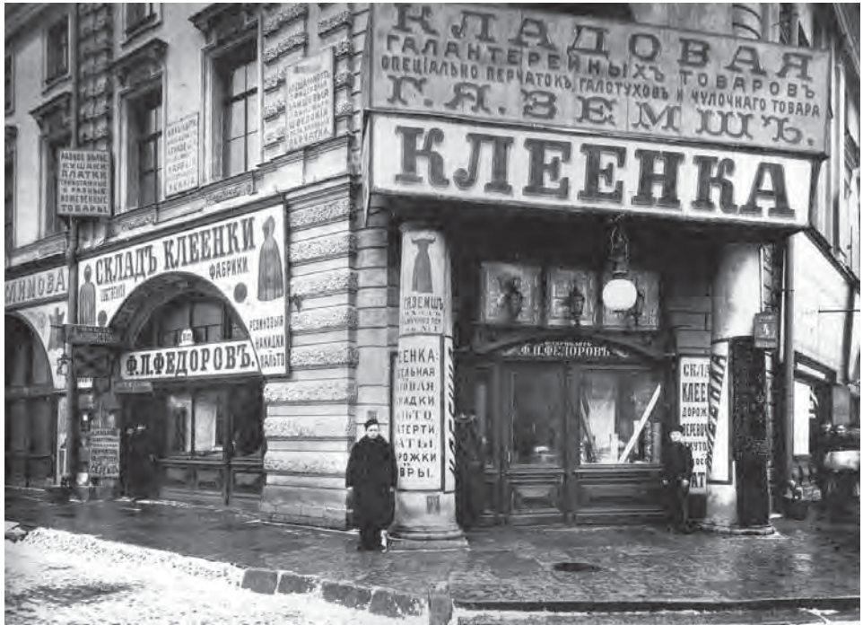
Afbeelding 4: St. Petersburg, Mutschnoi-sstraat, etalage van een winkel in wasdoek, c. 1900.

leefomstandigheden in Leningrad desastreus waren, richtten Iwan Grews en Nikolai Anziferow een instituut op voor systematisch onderzoek naar de historische topografie van de stad, waarin de methode en theorie van het excursiewezen (Exkursionistik) centraal stonden. Vanuit het instituut werden excursies georganiseerd naar de Newskij Prospekt: allesbehalve cultuurtoeristische rondleidingen, maar eerder oefeningen in topografisch veldwerk, gericht op het ter plekke zichtbaar maken van de geschiedenis. Excursies niet alleen naar de ‘verzonken’ Prospekt, maar ook naar andere stadswijken met hun kloosters, begraafplaatsen en stationsgebouwen. Rondleidingen door de vertrekken van de keizerlijke familie en adel in de verlaten paleizen, maar ook langs de heroïsche plaatsen van de Revolutie: door de fabrieken, scheepswerven en spoorwegemplacements waar zich stakingen, schermutselingen en bestormingen hadden afgespeeld. Tot aan het jaar 1929, toen dit particulier initiatief van praktisch geschiedenisonderwijs hardhandig werd beëindigd, manifesteerde deze massale behoefte aan historische kennis en nationale zelfbewustwording door volkskundige programma’s zich met een allure die hooguit vergelijkbaar was met die van de latere New Deal in de Verenigde Staten.