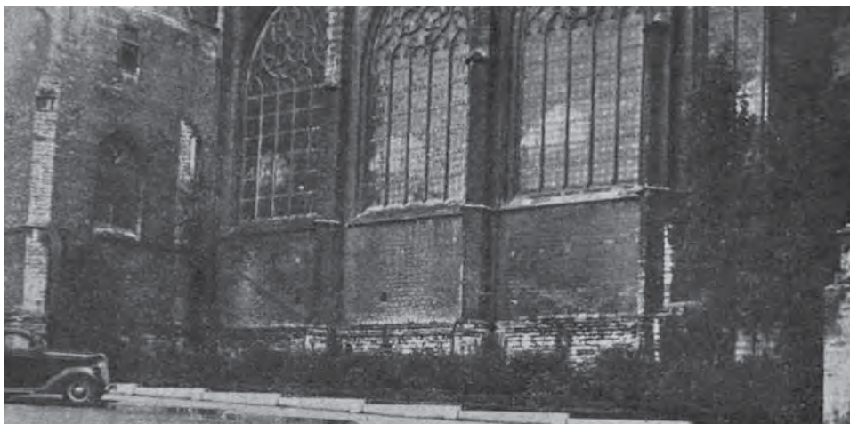
Afbeelding 6: Grasplantsoentje naast de Sint-Pieterskerk. Onderschrift: 'Op de Margaretha-plaats werd een stand voor autos [sic] aangebracht. Daarachter afsluiting [sic] en prachtige beplanting'. Foto uit het promotieboekje Hier het werk van de socialisten, 1938 (Stadsarchief Leuven, inv. 13929).