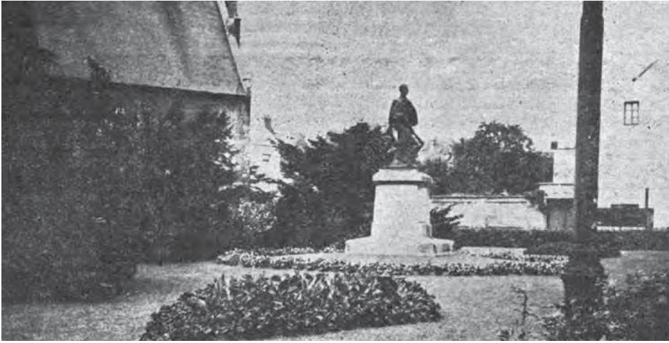
Afbeelding 5: Heraangelegd plantsoen naast de Sint-Jacobskerk. Onderschrift: 'Bij aanstelling van het nieuw bestuur beweerden de katholieken dat de socialisten den godsdienst zouden aanvallen en schaden. Loutere verdachtmaking! [...] De socialisten, in akkoord met de geestelijkheid, schepten [sic] rond vele kerken prachtige tuinen.' Foto uit het promotieboekje Hier het werk van de socialisten, 1938 (Stadsarchief Leuven, inv. 13929).

leverd, maar volgens de krant was het stedelijk tewerkstellingsbeleid doordrongen van 'vriendjespolitiek'. 63 Bovendien werd het stadsnatuurbeleid sarcastisch afgeschilderd als een antiklerikaal prestigeproject: 'Ge zult [in het nieuwe Albertlaan-parkje] de liberalen en socialisten [...] zien huppelen, dartelen als snullen, tuimelinkskes maken gelijk jonge snaken, schreeuwen en tieren dat het stof in de lucht zal vliegen'. 64 De Volkswil reageerde door te suggereren dat de kinderen van de 'klerikale' politici geen speelpleinen nodig hadden: zij konden hun vakantie immers wél 'aan zee' doorbrengen. Daarnaast stelde de socialistische krant dat de nieuwe parkjes gedeeltelijk werden gesubsidieerd door het provinciebestuur, en dat deze subsidies reeds werden aangeboden ten tijde van het katholiek-liberale schepencollege, maar toen ongebruikt waren gebleven. 65