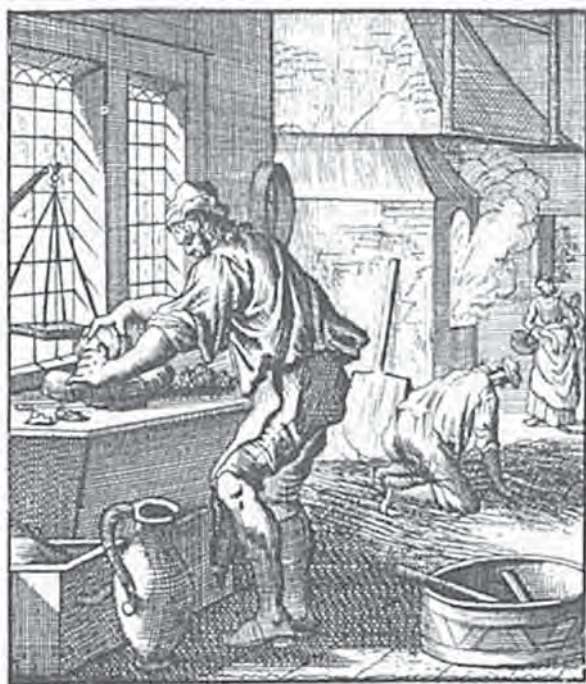
Afbeelding 3: 'Bakker', Prent van Jan Luyken, 1694, Jan Luyken, Afbeelding der Menschelyke Bezigheden, Spiegel van het Menslyk Bedryf (Amsterdam 1697).

wijzen de casussen van twee weduwes 57 en twee bakker-weduwenaars 58 in ieder geval weer in de richting van een multicausaal patroon. Een bakker-weduwenaar hertrouwe tussen zeven à acht maanden na het overlijden van diens echtgenote. Weduwes van bakkers deden er in deze casus langer over. Bij hen was het moment van hertrouw gelegen tussen de drie à vier jaar na het overlijden van hun echtgenoot. Wellicht moet de oorzaak hiervan niet zozeer worden gezocht in het open of gesloten karakter van de beroepsgroep of de noden van het familiebedrijf, maar wel in erfenskwesties. Door de snelle hertrouw, het vaak grote leeftijdsverschil en het feit dat deze bakkersgast 'voorrang' verkreeg ten aanzien van bakkerszonen om aan het hoofd van een bakkerij te staan, waren de erfenisrechten in huwelijken van weduwen vaak een gevoelige kwestie. Kaplan stelde vast dat bakker-weduwenaars vaak huwden met een veel jongere bakkersvrouw, alsook met vrouwen die helemaal niet vertrouwd waren met de (klein)handel en zelfs povere bruidsschatten met zich meebrachten. De reden hiervoor zou gezocht moeten worden in de aanwezigheid van (bakkers)kinderen van zowel we-