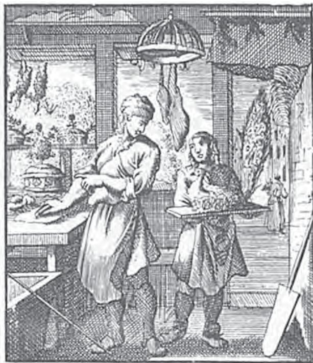
Afbeelding 4: 'Pasteibakker', Prent van Jan Luyken, 1694, Jan Luyken, Afbeelding der Menschelyke Bezigheden, Spiegel van het Menslyk Bedryf (Amsterdam 1753).

één of meerdere kinderen huwden en de ouderlijke bakkerij verlieten. Niettemin kon voor elk van de zeventien casussen vastgesteld worden dat minstens één bakkerszoon werkzaam bleef in de bakkerij, huwde en er samen met zijn echtgenote werkzaam bleef, al dan niet in samenwerking met ongehuwde broers en zussen onder de hoede van de 'weduwe-boulangère' die in elk van de gevallen eigenares van het pand bleef tot aan haar overlijden.