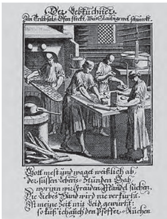
Afbeelding 2: 'Koekebakker', Prent van Jan Luyken, 1698; Christoph Weigel, Abbildung der Gemein-Nützlichen Haupt- Stände, Ständebuch .