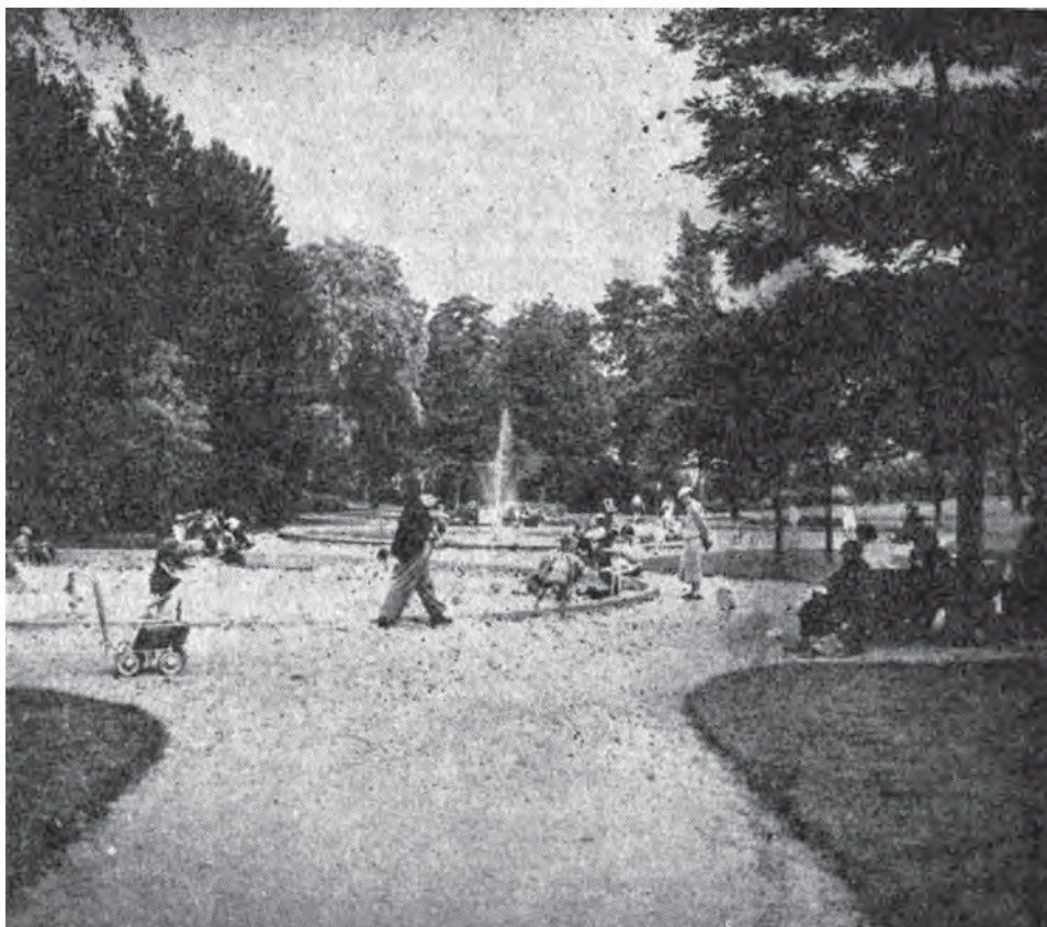
Afbeelding 4: Nieuw parkje en speelplein nabij de stadsbegraafplaats.

schilderen een ander mentaliteit als de onze, deden ons begrijpen dat die vrouw een ander begrip had in zake eerbiediging der openbare beplantingen.