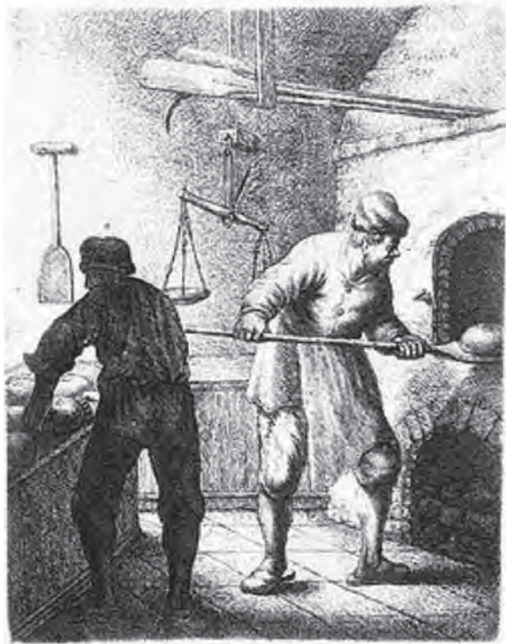
Afbeelding 1: 'Bakker', Ets van J.G. Van Vliet, 1635, Rotterdam, Atlas van Stolk, Tekeningen Van Vliet.

monium of beroep? Voor het beantwoorden van deze vraag zal in dit artikel worden ingezoomd op de Brusselse bakkers, een typische en relatief stabiele stedelijke midden-groep. Ook de keuze voor de hoofdstad van de Oostenrijkse Nederlanden biedt interessante perspectieven. Vanaf de tweede helft van de achttiende eeuw tekende zich in Brussel, meer dan elders, een spanningsveld af tussen een behoudsgezinde corporatieve wereld enerzijds en de 'moderne wereld' beheerst door het grootkapitaal en groepen uit de financiële wereld en de vrije beroepen, anderzijds. Brussel transformeerde op enkele generaties tijd van een 'corporatistisch bolwerk' naar de eerste moderne (liberale) natiestaat op het continent. De bakkers, die enerzijds stevig geworteld waren in de corporatieve wereld en zich anderzijds dienden aan te passen aan de vereisten van een moderne kleinhandelssector, moeten deze spanning ongetwijfeld hebben gevoeld.