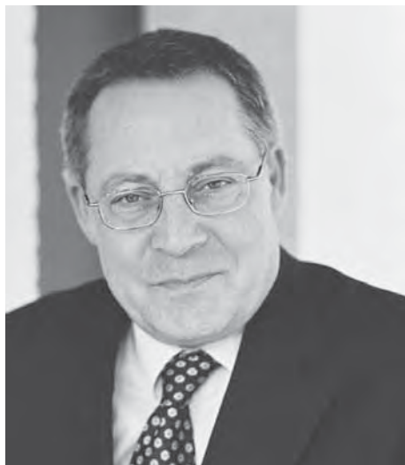
Afbeelding 1: Karl Schlögel (1948).

van nieuwe registers in de geschiedwetenschappen en met zijn boeken de stadsgeschiedenis verrijkt heeft met de werkwijzen van de journalist, archeoloog en literator. 6