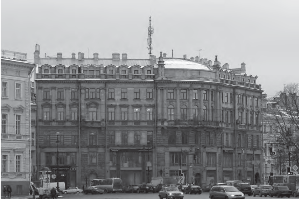
Afbeelding 3: St. Petersburg, Nevskij-Prospekt, gezicht naar het noorden.