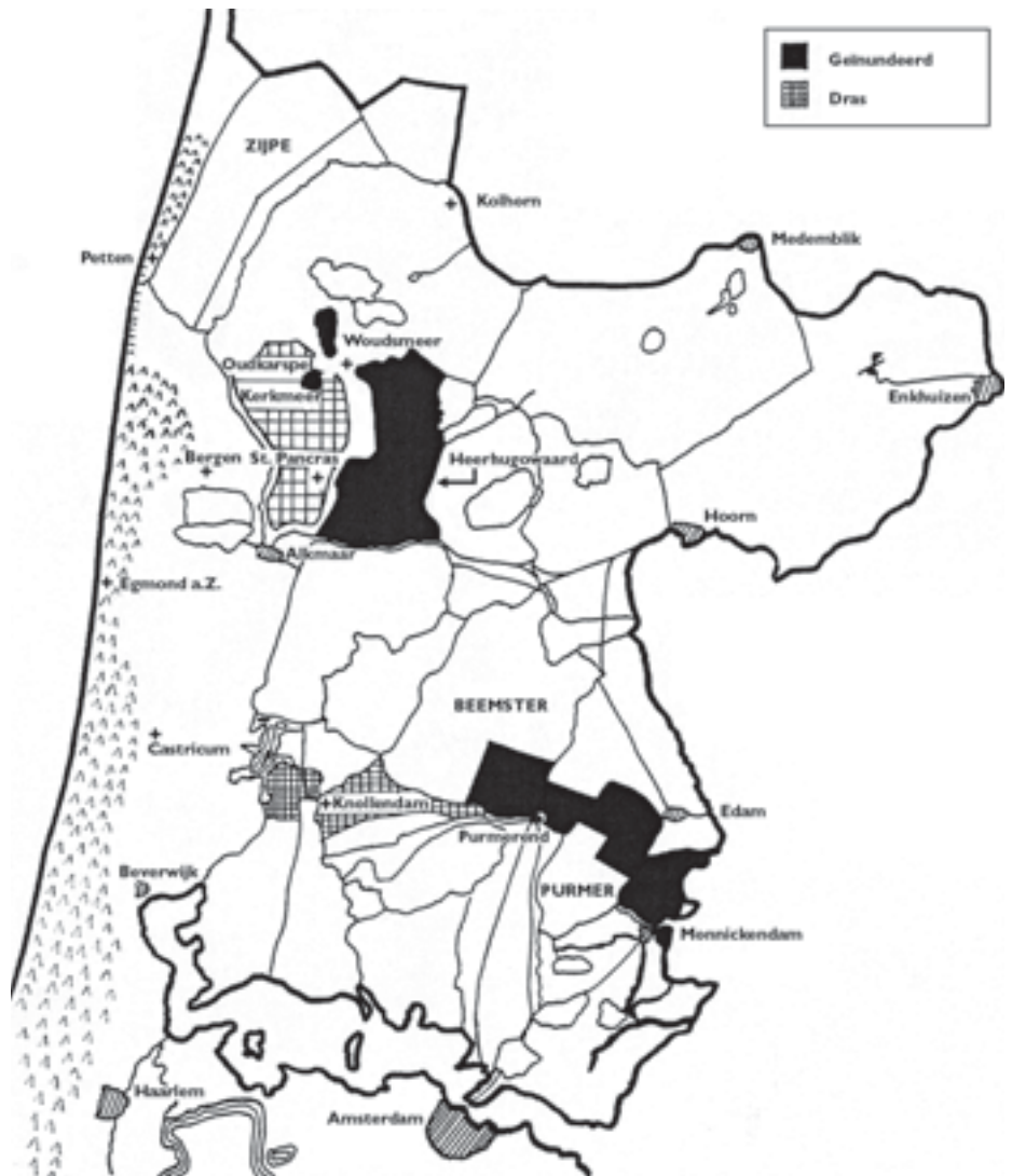
Afb. 2. Kaart van de door de Bataafse genie tijdens de invasie onder water gezette gebieden (D. Aten, 1999).