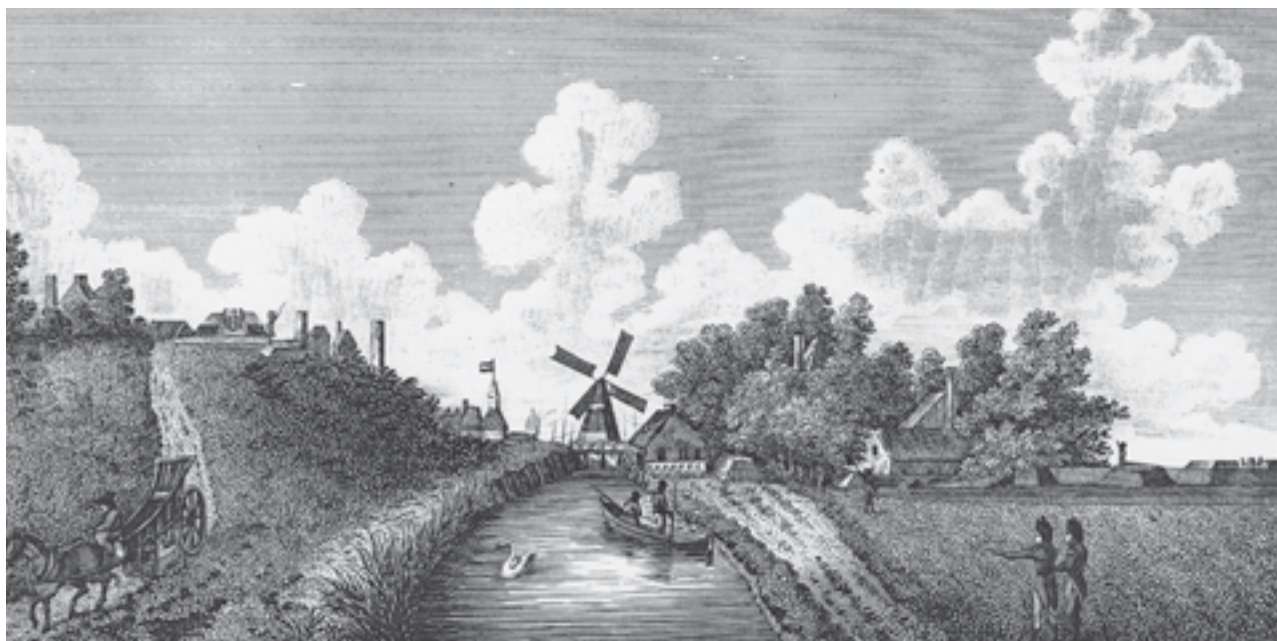
Afb. 1. Engelse versterkingen bij het dorpje Oude Sluis in de Zijpe.