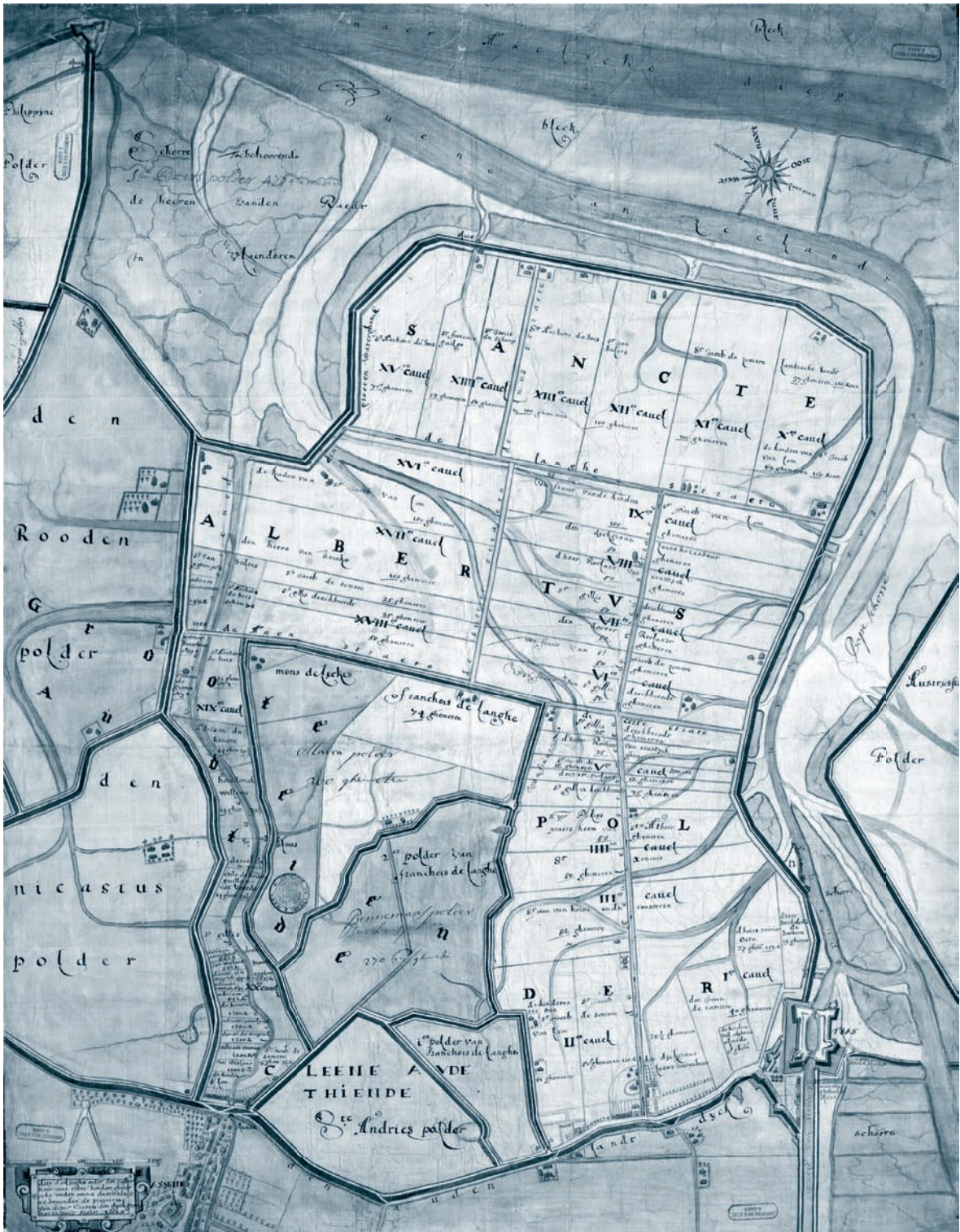
Afb. 1. Kaart van de Albertpolder in 1620, dus van kort na de inpoldering (1612). De kaart werd gemaakt door de Gentse landmeter Lucas Ho(o)re(n)bau(l)t, die bij de aanleg van de polder nauw betrokken is geweest. Hij bezat in de polder diverse landerijen en een boerderij en is er ook nog een aantal jaren dijkgraaf geweest. De limitscheydinghe van 1664 werd dwars door deze polder getrokken en volgde (ten oosten van sas van Gent) de Nieustraete en Geulestraete tot aan de Langhestraete. Vanaf hier liep de grens in westelijke richting tot aan de zeedijk. Van daar liep de grens verder in westelijke richting langs de buitenteen van de dijk. Rijks-archief Gent, kaart nr. 672.